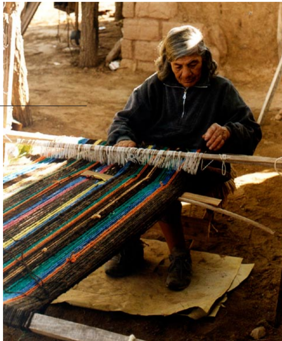
Barrio El Salitral, Santa Rosa, ca.1960

El quinto capítulo -Ciclos de migración hacia las ciudades (1940-1970)- caracteriza las formas de movilidad espacial temporaria de los indígenas y los motivos por los que empeoraron las condiciones de vida en la zona, a partir de la desertificación ocasionada por el corte del río Atuel y la merma de los caudales del Salado-Chadileuvú, así como el control cada vez mayor de parte de propietarios privados que comenzaron a alambrar y coartar el acceso a los recursos estratégicos del agua, la leña y las pasturas para el ganado.