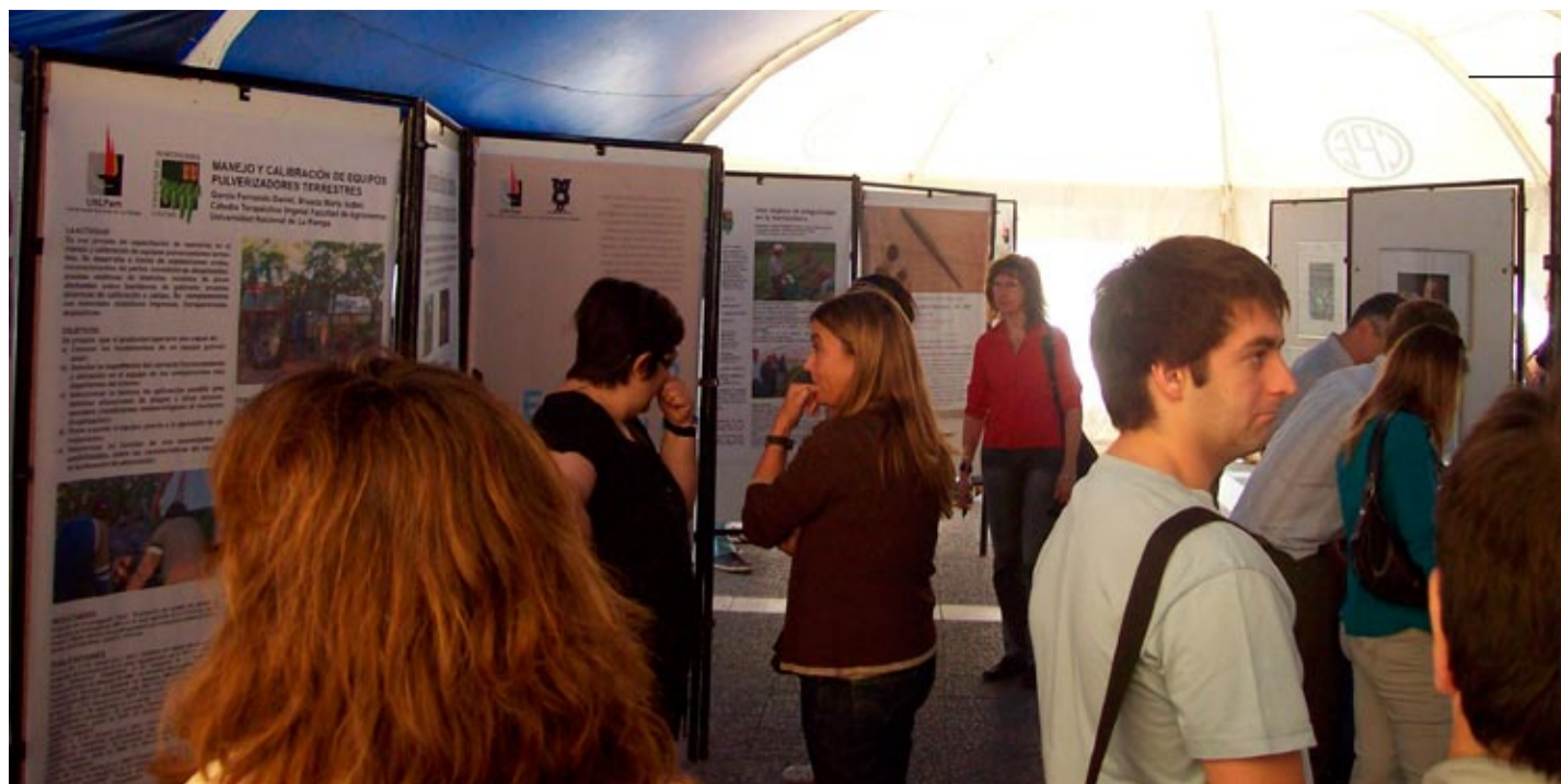
En una carpa en la Plaza San Martín se expusieron los trabajos de extensión que se desarrollan en la UNLPam (Izquierda).