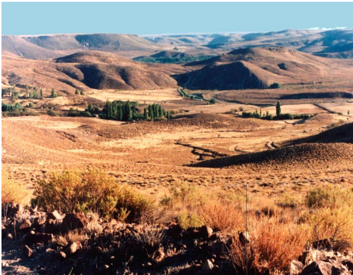
Arroyo Pichileufú en el paraje Corralito. Puede observarse el valle y, hacia el fondo, las mesetas. El área de estudio abarca la cuenca del mencionado curso desde este sector hasta su desembocadura en el río Limay.