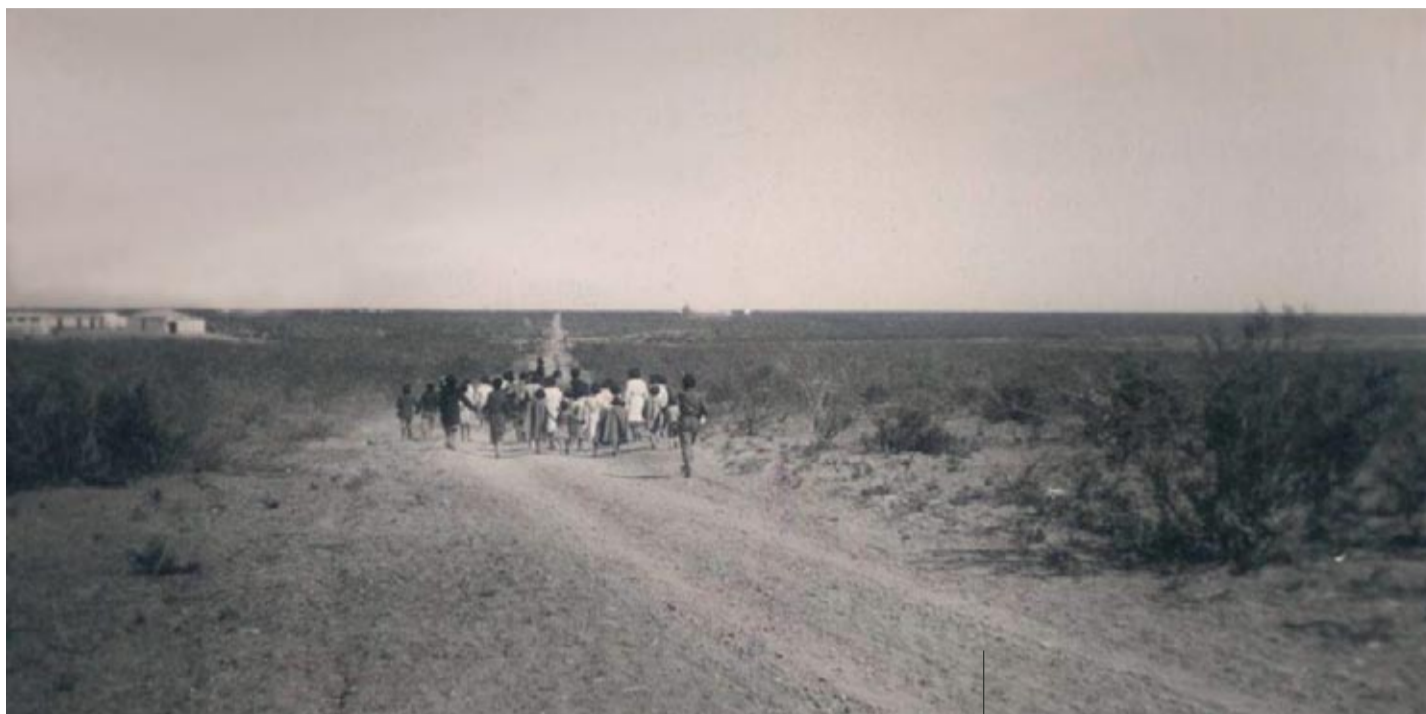
Camino a la escuela.

“Como el río Salado, la historia de Puelches ha transitado por momentos de prosperidad y bonanza y por otros de carencias y dificultades. El hambre, la falta de agua y el despoblamiento amenazaron una y otra vez la supervivencia del pueblo. Pero el espíritu de sus habitantes pudo más y los esfuerzos por salir adelante se multiplicaron”.