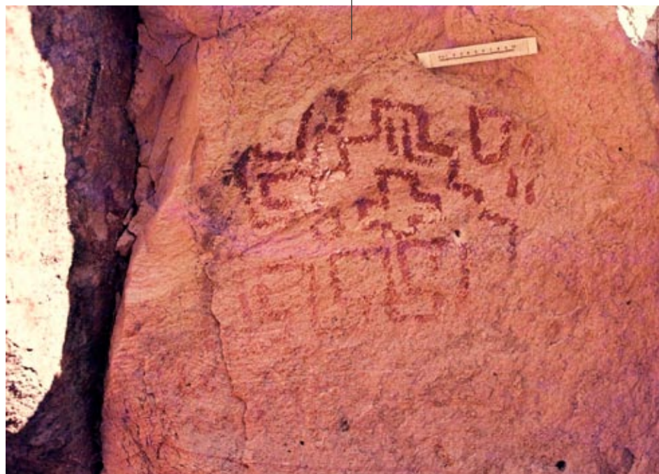
Pinturas de Casa de Piedra de Curapil.

con motivos del estilo de “pisadas”. Al finalizar la obra, las investigaciones se enmarcaron en proyectos subsidiados por CONICET, UBA y la Agencia Nacional de Promoción Científica. En 2006 se firmó un convenio con la Universidad de Cantabria y desde entonces se realizan trabajos conjuntos con investigadores del Instituto de Prehistoria de esa Casa de Estudios.