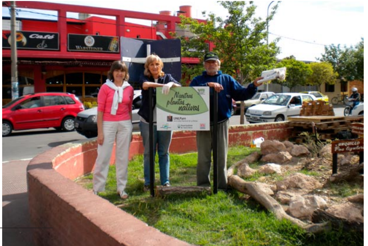
En la plaza San Martín se crearon pequeños jardines que permiten a los pampeanos conocer y revalorizar su patrimonio natural.

Convencidos de que nadie valora aquello que no conoce, los impulsores del proyecto consideran que es un buen comienzo para que la incorporación de especies nativas, usadas junto a muchas otras exóticas de muy buen desempeño en nuestro medio, se generalice en el diseño de los espacios verdes de la ciudad y también del resto de la provincia. Por otra parte, el hecho que las instituciones públicas del medio lleven adelante proyectos conjuntos, unificando esfuerzos y potenciando resultados, es una práctica altamente saludable, que contribuye a una menor dispersión de recursos de todo tipo y favorece la consolidación de los vínculos no solo entre las instituciones sino, y principalmente, entre las personas que las conforman. ■